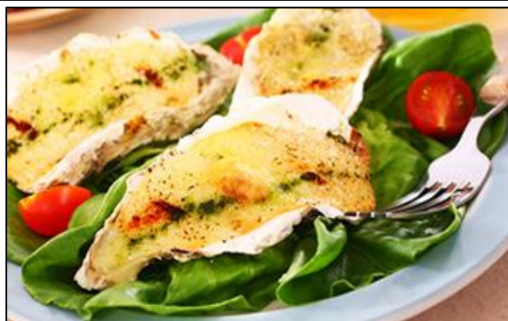
Гратен из устриц в раковине Первое место по доле рынка в Японии. Мы используем только устрицы, вылавливаемые в самый подходящий сезон. А с помощью оригинального соуса нам удаётся сохранить вкус и аромат исходных продуктов.