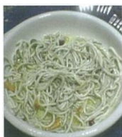
Имитация мальков угря