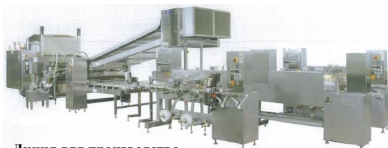
Линия для производства крабовых палочек

Мы стремимся внести вклад в повышение уровня качества питания в мире путём предоставления нашего оборудования и ноу-хау клиентам, тем самым способствуя распространению безопасных и надёжных продуктов питания.