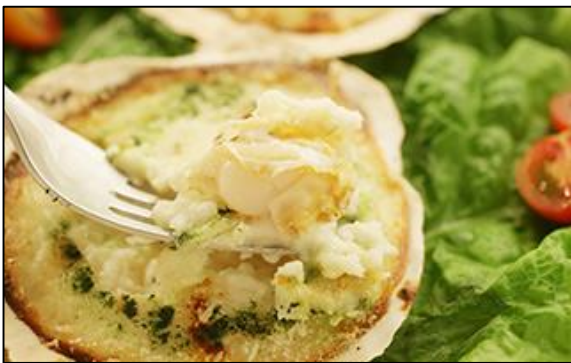
Гратен из морского гребешка «Канки» использует гребешки из г. Муцу префектуры Аомори и с Хоккайдо. С помощью оригинального соуса нам удаётся сохранить вкус и аромат исходных продуктов.