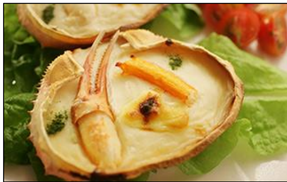
Гратен из краба в панцире Аппетитный гратен, где в качестве посуды выступает собственный панцирь краба. С помощью оригинального соуса нам удаётся сохранить вкус и аромат исходных продуктов.