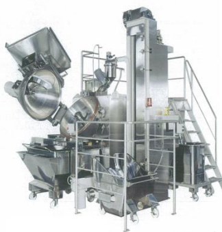
Резак для смешивания, измельчения и создания однородной массы