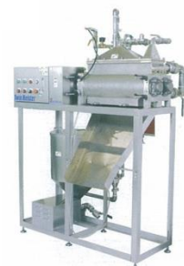
Установка для производства соевого молока TWIN MEISTER