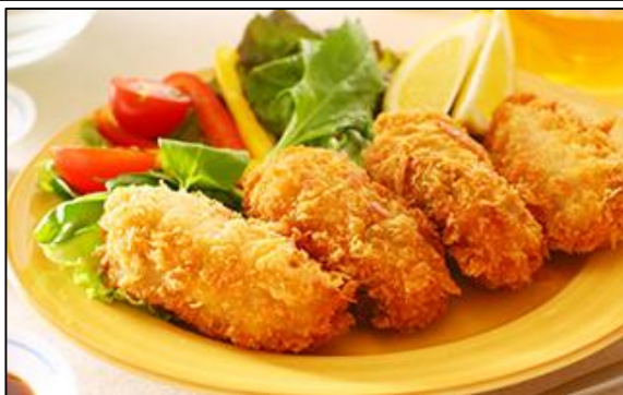
Какифурай (устрицы во фритюре) «Канки» занимает 10% доли рынка в Японии. Мы используем только устрицы, вылавливаемые в самый подходящий сезон. Не забываем мы и о качестве панировки, чтобы получалась вкусная хрустящая корочка.